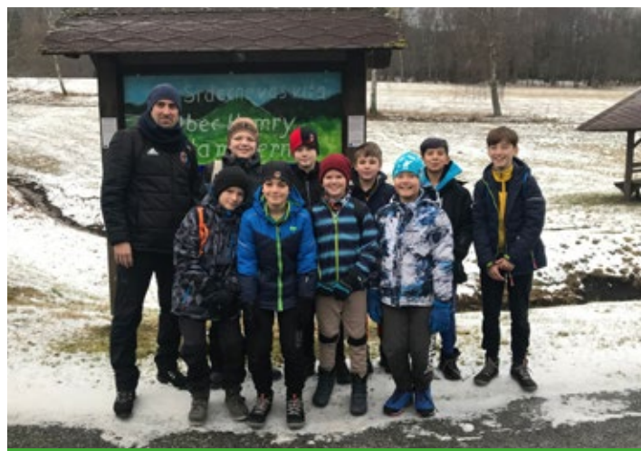
Soustředění mladších žáků na Zelené Lhotě

a uskutečnil se tradiční biatlon. V přípravě se také uskutečnily tři halové turnaje, které jsou spíše zpestřením pro kluky. Sehrajeme ještě nějaké přátelské zápasy a můžeme se těšit na jaro. ■