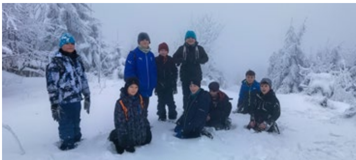
Zimní sněhové radovánky na soustředění mladších žáků

Podzimní sezónu kluci skončili na 8. místě, se kterým nemůžeme být spokojeni. Jelikož pouze týmy SK Petřín Plzeň U11 a Starý Plzenec byly nad naše síly. Ostatní zápasy kluci vždy ztratili individuálními chybami či svojí nekoncentrovaností. Ale protože máme převážně kluky ročníku 2009, jsou to pro ně neskutečné zkušenosti. Věřím, že na jaře odehrajeme ve skupině D důstojnou roli a budeme každý zápas bojovat na 100%. Podzimní část nám skončila na konci října, v listopadu si kluci odpočinuli a od 2. prosince se opět začalo trénovat. Jeden trénink venku a druhý v malé tělocvičně. Začátkem ledna proběhlo zimní soustředění na Zelené Lhotě, kde kluci poznali krásy přírody, proběhl výšlap na Ostrý (1 293 m.n.m.)