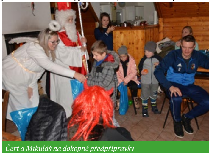
Čert a Mikuláš na dokopné předpřípravky