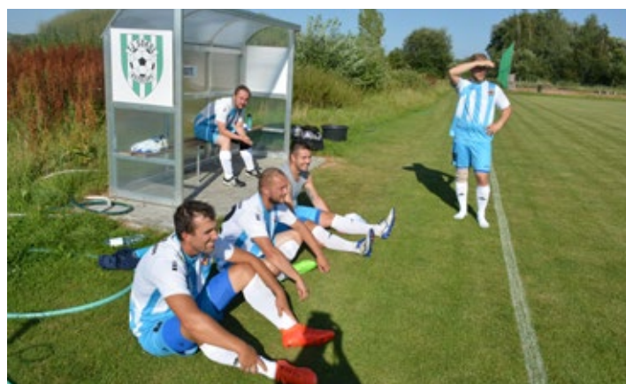
Momentka ze střídačky při přátelském zápase v Kozolupech