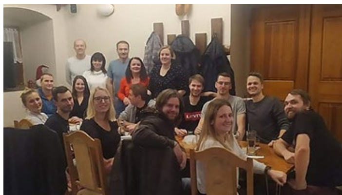
Společné posezení smíšenek a hodnocení uplynulé sezóny