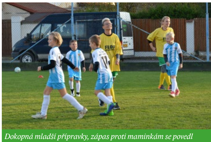
Dokopná mladší přípravy, zápas proti maminkám se povedl

Podzimní část sezóny byla pro kluky velkou zkouškou. Více než polovina hráčů přišla z předpřípravky a to bylo v prvních zápasech vidět. Mladší kluci si museli zvyknout na rychlejší bojovnější fotbal. Velmi jim v tom pomohli kluci, kteří v mladší přípravce zůstali. Začali jsme trénovat už v srpnu a absolvovali soustředění na Radosti u Hracholuské přehrady. A pak už jsme se vrhli do zápasů, které se hrály turnajovou formou. Celkem jsme odehráli 8 turnajů, na každém jsme se vždy utkali se 3 týmy. V prvních zápasech nás soupeři ve všech směrech přehrávali. Postupem času s tím, jak se kluci zlepšovali, jsme začali hrát