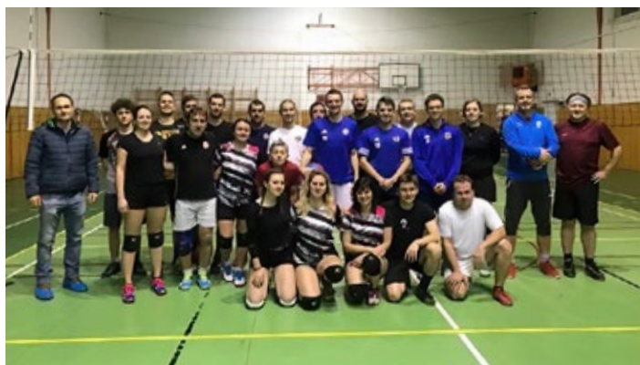
VOTBAL: fotbalisté Sokola proti volejbalovým smíšenkám