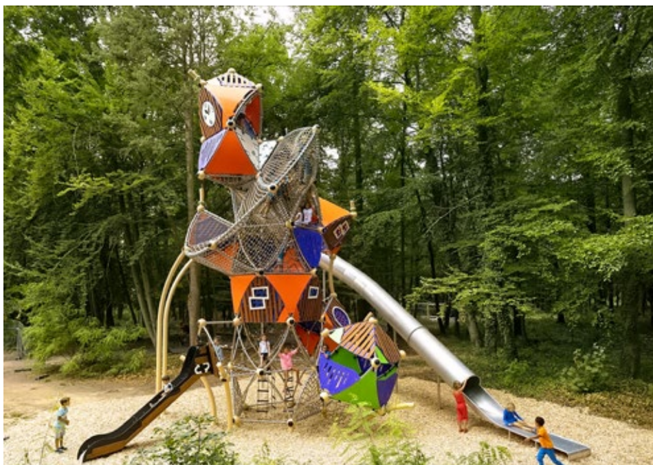
Vyšplhat na skluzavku Triitopia je pro děti výzva. Tuto filozofii vyznává německý výrobce

S tím souhlasí i pojišťovny. Například studie z roku 2004 zjistila, že u dětí, které si v raném věku zlepšily své pohybové