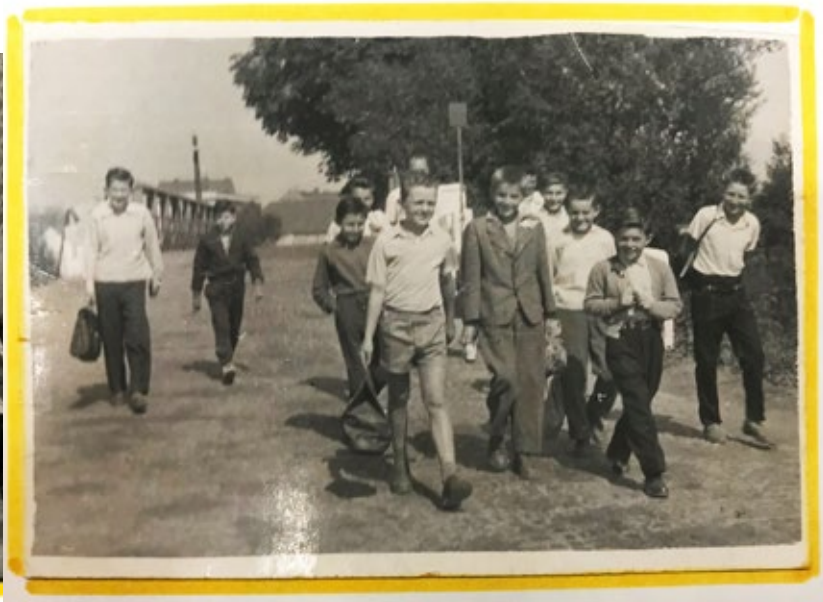
▲ 1960: Jdeme hrát do Kozolup