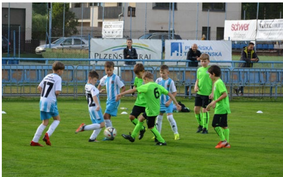
Turnaj starších přípravek, zápas proti Chrástu